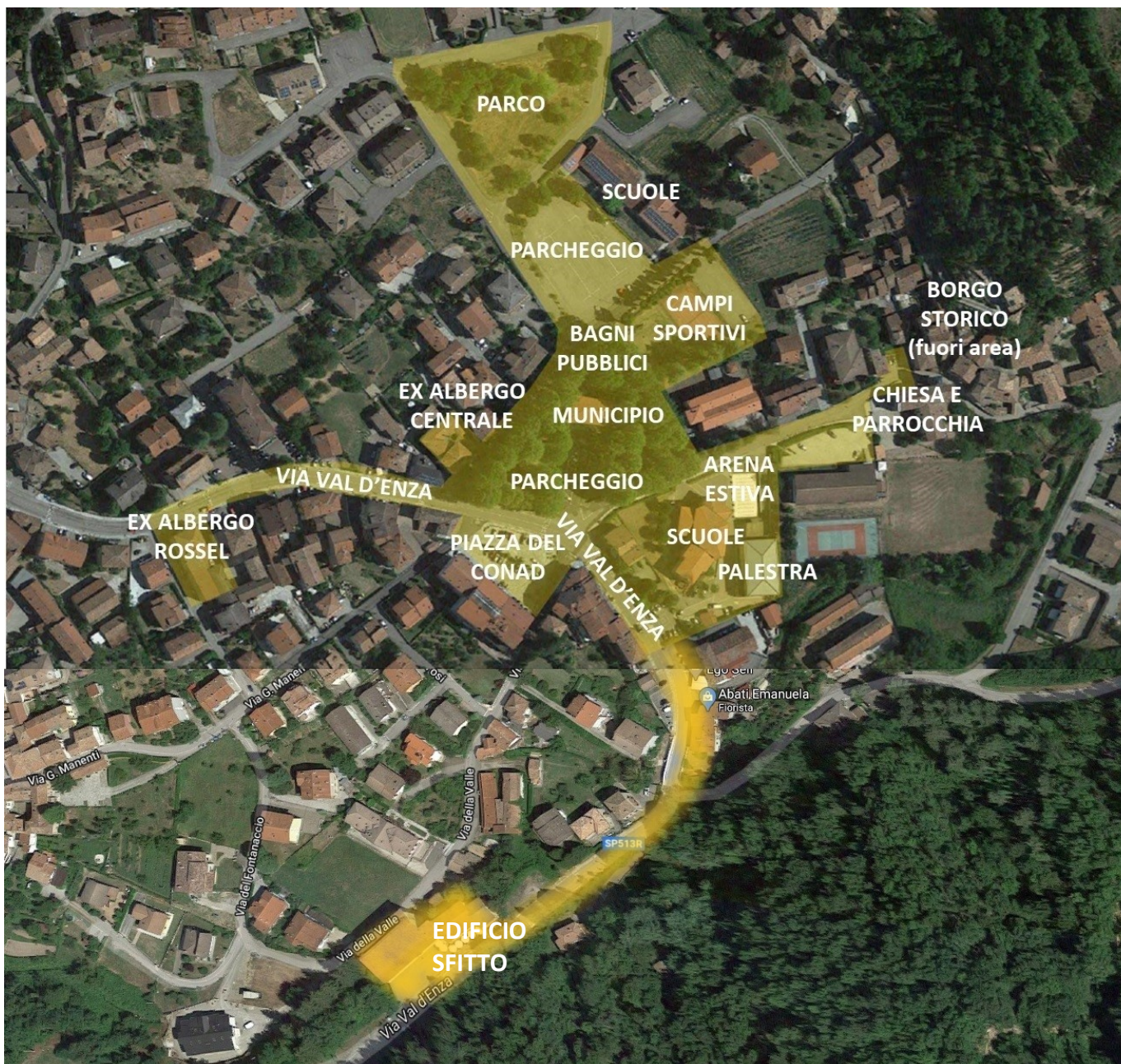
AMBITO INDICATIVO DEL PROGRAMMA DI RIGENERAZIONE URBANA